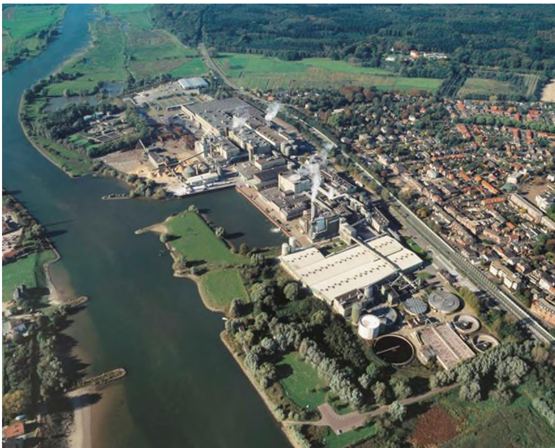
Figuur 1 Locatie van SK PARENCO tussen het Renkums Beekdal, de Nederrijn en het dorp Renkum.